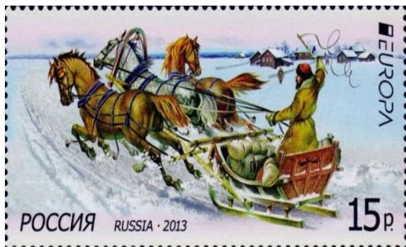
Марка с изображением почтовой тройки

К началу XIX века была достроена самая длинная почтовая дорога в мире – Сибирский почтовый тракт. Он протянулся от