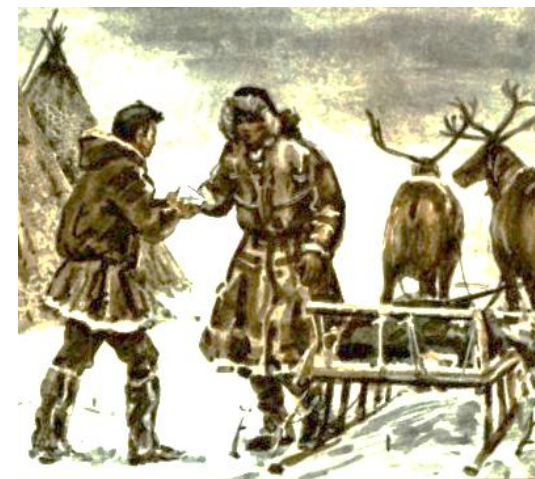
Кочевая почта Севера

Кочевая почта всегда работала быстро, на совесть. Передать письмо в нужные руки каждый считал делом чести. Но соблюдался и ещё один обычай: если к пакету, который тебе передали, прикреплено перо птицы, сразу меняй маршрут. Спешу туда, куда велит письмо с пером. Там что-то случилось.